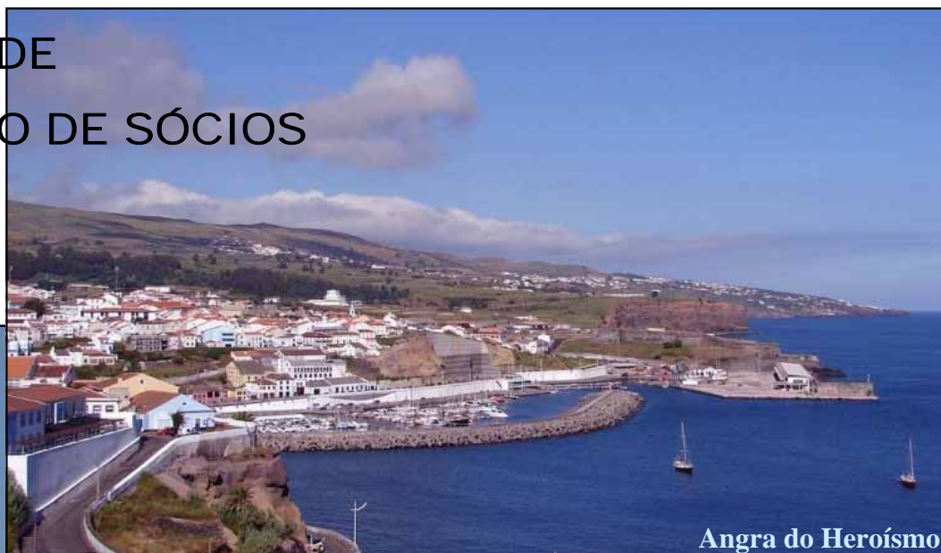
Angra do Heroísmo