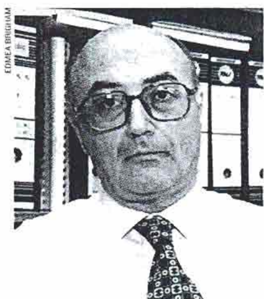
BETTENCOURT PICANÇO «Pelos vistos, os lugares de topo já não chegam...»

E, de lei em lei, os Governos foram trocando acusações de clientelismo e jurando boas intenções. Guterres disse, em 1995, «no jobs for the boys» (qualquer coisa como: «nada de tachos para a rapaziada»). Em 2001, Durão acusou o PS de ter nomeado 14 mil boys . Em 2003, o PSD já contabilizava mais de 3 mil nomeações políticas feitas num só ano por Durão. Santana Lopes admitiu