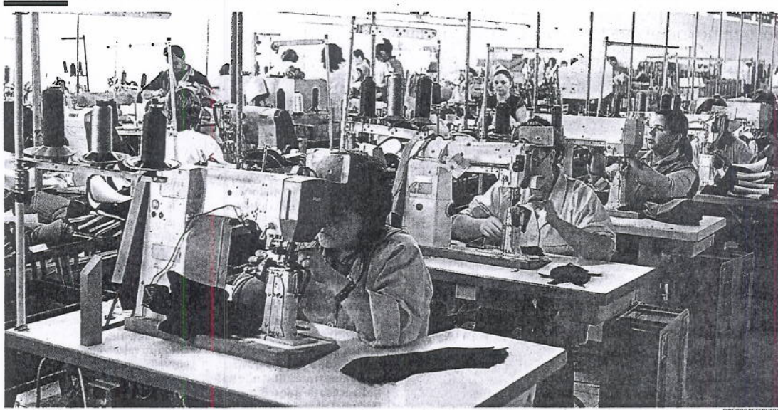
Os trabalhadores menos qualificados e os jovens são os que enfrentam maior risco de abandonar mercado de trabalho