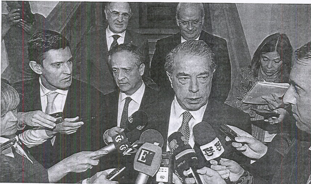
Bancos dizem estar estrangulados com novos critérios de regulação. Governo responde, devolvendo 3,3 mil milhões em liquidez

Folga? Primeiro-ministro admite que não existe. Dinheiro é para pagar dívidas à banca