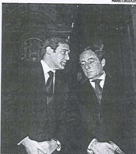
CDS veio explicar melhor as declarações de Passos Coelho