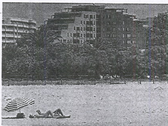
Portugueses são os primeiros em número de turistas no Algarve