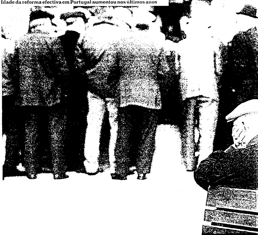
Idade da reforma efectiva em Portugal aumentou nos últimos anos